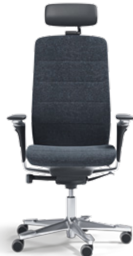
Polished Edition (EDP)