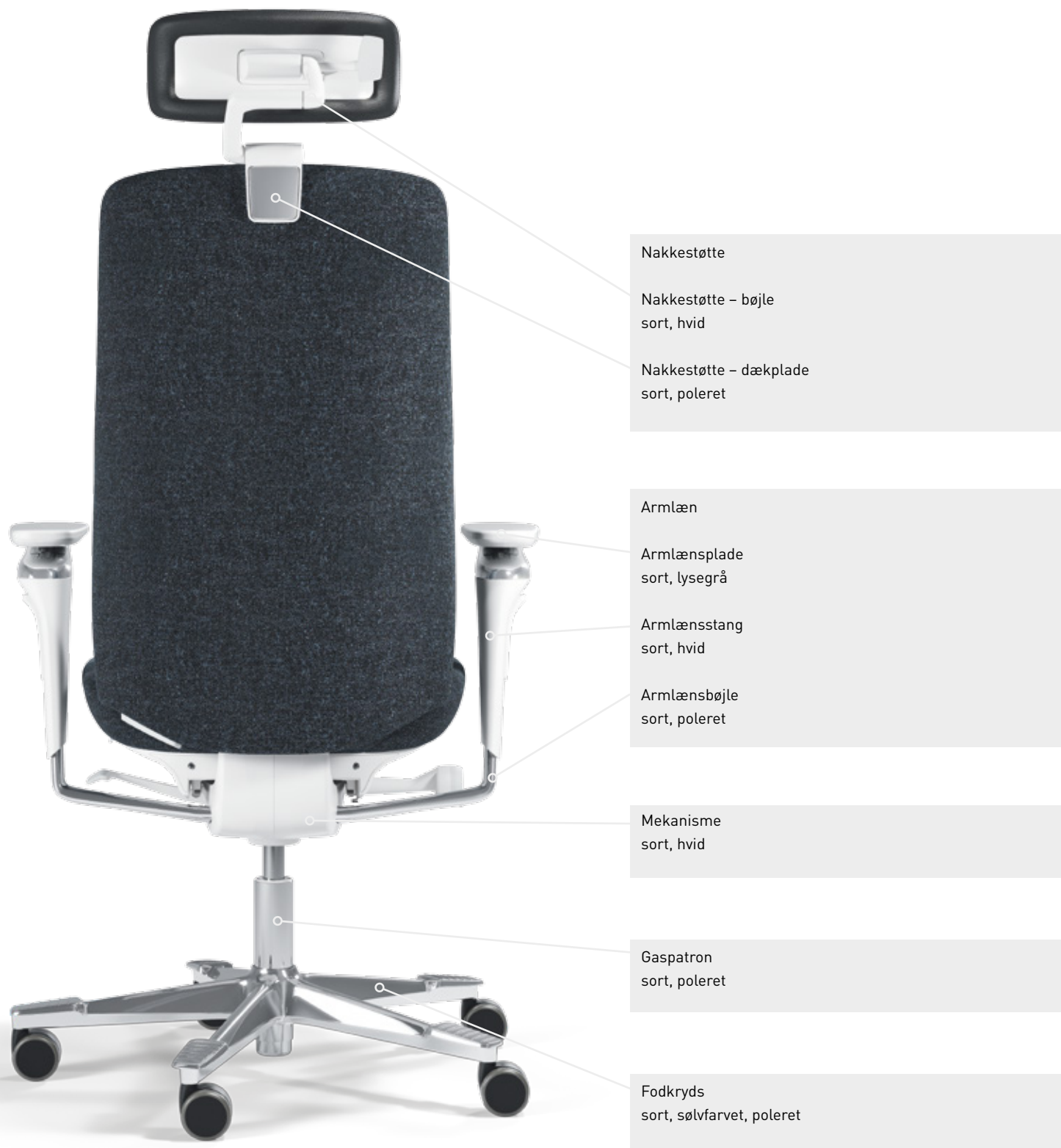
White Edition (EDW)