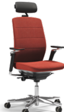
CF111 (armlæn + NC-nakkestøtte)