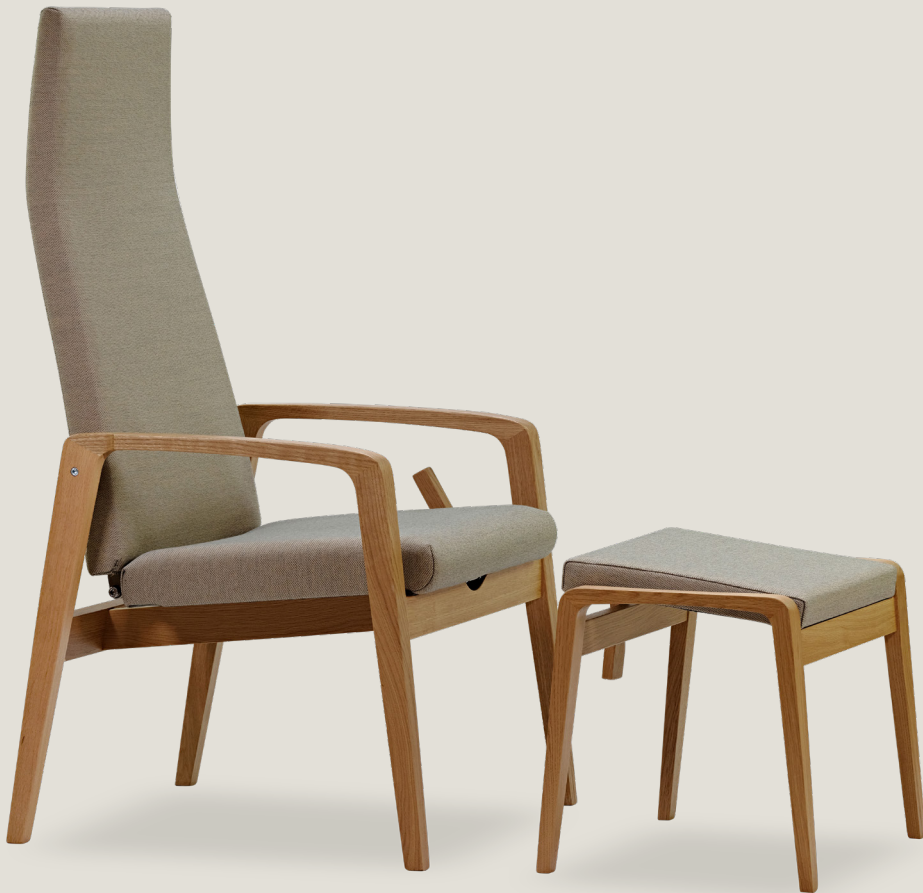
7021 SJ i eg.

Et velafprøvet og gennemtænkt design definerer 7000-serien, hvor hvilestolene er ideelle til en bred vifte af miljøer, særligt indenfor pleje- og sundhedssektoren.