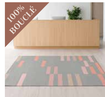
Natural Units GREY/ROSE 250x350 cm. Mdl. lejepris DKK 100,-