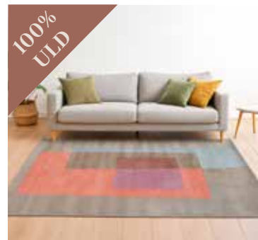
Squares Tones RED 250x350 cm. Mdl. lejepris DKK 150,-