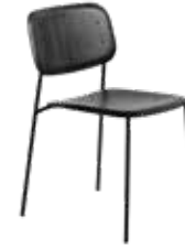
HAY Soft Edge 40 sort/sort Mdl. lejepris DKK 80,-