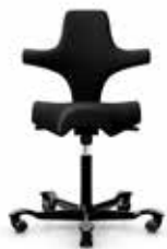
HÅG Capisco 8106 sort/sort Mdl. lejepris DKK 200,-