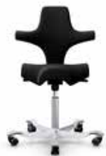
HÅG Capisco 8106 sort/silver Mdl. lejepris DKK 200,-