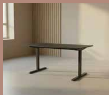
ZOLID MEET 140x80 Mdl. lejepris DKK 140,-

Bordplade: Sort linoleum Stel: Sort pulverlakeret stål Mål: Ø:80xH:72 cm.