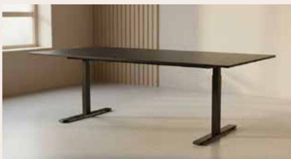
ZOLID MEET mødebord 220x100 Mdl. lejepris DKK 160,-

Rektangulær bordplade på 220x100 cm i sort linoleum. T-stel i sort pulverlakeret stål. Fast højde på 72 cm. (inkl. bordplade).