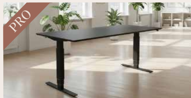
Hæve sænkebord 180x80 DKK 160,-

Højdejustering: 63 - 129 cm Bordplade: Sort linoleum med sort faset kant Stel: Pulverlakeret stål i valgfri farve