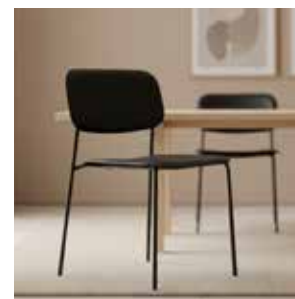
HAY Soft Edge 40 mødestol, sort/sort Mdl. lejepris DKK 80,-

Mødestol fra HAY i let, organisk og komfortabelt design.