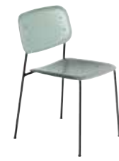
HAY Soft Edge 40 grøn/sort Mdl. lejepris DKK 80,-