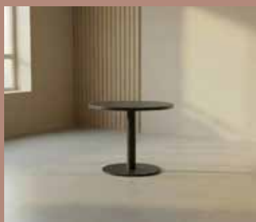
ZOLID MEET Ø80 Mdl. lejepris DKK 95,-

Bordplade: Sort linoleum Stel: Sort pulverlakeret stål Mål: Ø:80xH:72 cm.