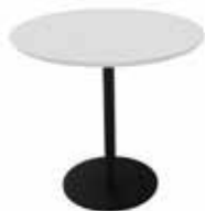
Zolid Eat Ø80 Mdl. lejepris DKK 95,-

Zolid MEET mødeborde Højde: 72 cm. inkl. bordplade Bordplade: Sort linoleum med sort faset kant T-stel: Sort pulverlakeret stål