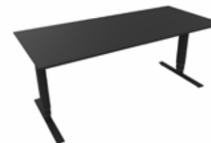
Hæve sænkebord 180x80 PRO sort/sort Mdl. lejepris DKK 160,-