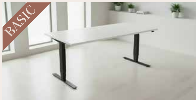
Hæve sænkebord 160x80 DKK 150,-

Højdejustering: 68,5 - 115,5 cm Bordplade: 25 mm laminat med en glat ABS-kant Stel: Pulverlakeret stål Farver: Valgfri bordplade og stel farve: