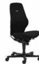
Kinnarps 6770 sort/sort Mdl. lejepris DKK 165,-