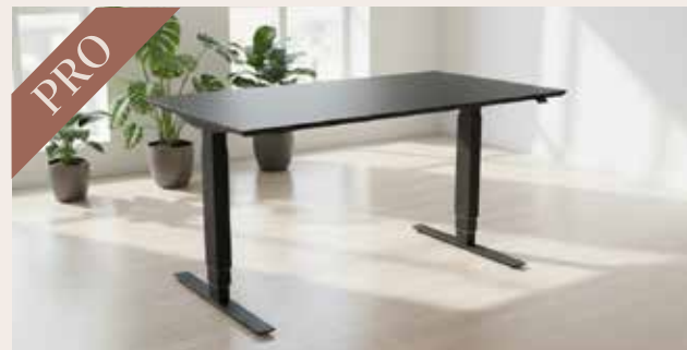
Hæve sænkebord 140x80 DKK 155,-

Højdejustering: 63 - 129 cm Bordplade: Sort linoleum med sort faset kant Stel: Pulverlakeret stål i valgfri farve