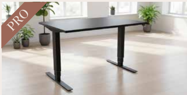
Hæve sænkebord 120x80 DKK 155,-

Vores PRO hæve sænkeborde er alle udført med en flot og eksklusiv linoleum bordplade med faset kant samt elektrisk hæve/sænke stel i pulverlakeret stål.