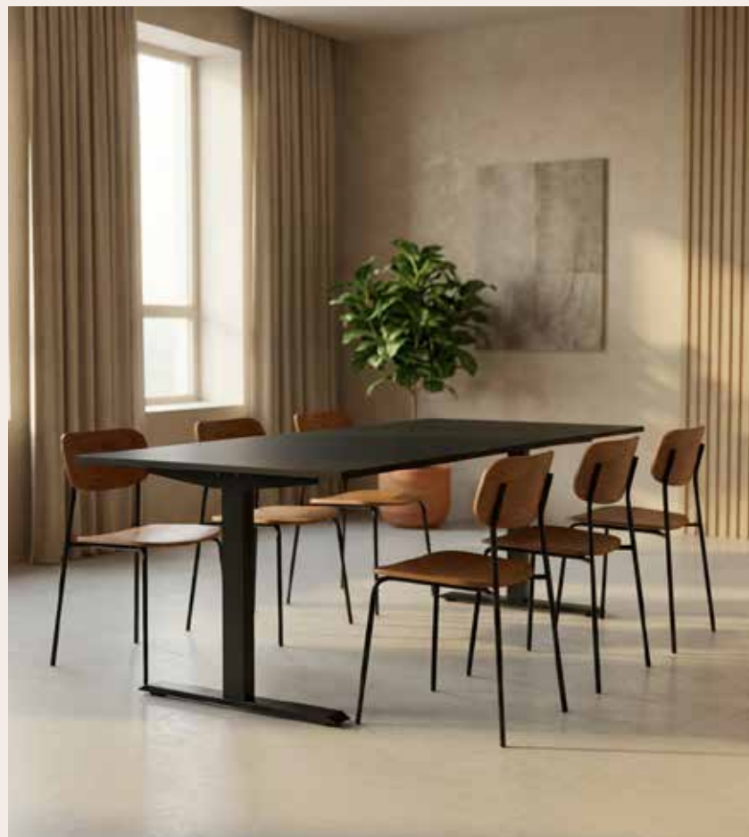
ZOLID MEET mødebord 180x80 Mdl. lejepris DKK 150,-

Klassisk og tidsløs m/ træsæde og ryg. Sort pulverlakeret metal stel.