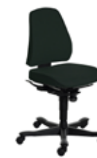
Kinnarps 6110 sort/sort Mdl. lejepris DKK 150,-