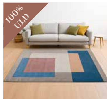
Squares Tones BLUE 250x350 cm. Mdl. lejepris DKK 150,-