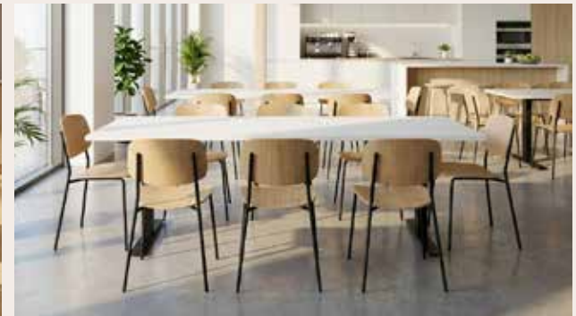
ZOLID EAT 180x80 kantine bord Mdl. lejepris DKK 145,-

Rektangulær bordplade i sort el. hvid laminat. T-stel i sort el. silver med fast højde på 72 cm. inkl. bordplade.