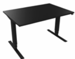
Hæve sænkebord 120x80 PRO sort/sort Mdl. lejepris DKK 155,-