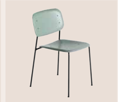
HAY EDGE kantine stol Mdl. lejepris DKK 80,-

Stabelbar kantine stol i let, organisk og komfortabelt design.