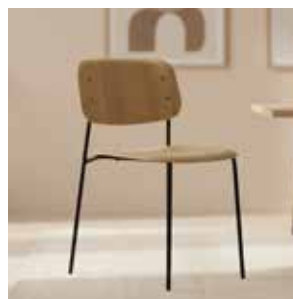
HAY Soft Edge 40 mødestol, eg/sort Mdl. lejepris DKK 80,-

Mødestol fra HAY i let, organisk og komfortabelt design.