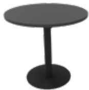
Zolid Meet Ø80 sort/sort Mdl. lejepris DKK 95,-