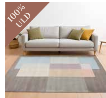
Squares Tones WHITE 250x350 cm. Mdl. lejepris DKK 150,-