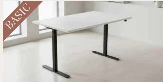
Hæve sænkebord 140x80 DKK 145,-

Højdejustering: 68,5 - 115,5 cm Bordplade: 25 mm laminat med en glat ABS-kant Stel: Pulverlakeret stål Farver: Valgfri bordplade og stel farve: