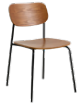
Clara mødestol / kantinestol Mdl. lejepris DKK 80,-