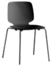
Babila mødestol / kantinestol Mdl. lejepris DKK 80,-