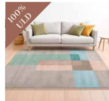
Squares Tones GREEN 250x350 cm. Mdl. lejepris DKK 150,-