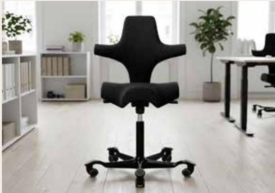
HÅG Capisco 8106 sadel kontorstol Mdl. lejepris DKK 200,-

Materiale: Select stof, sort 60999 Stel: Vælg mellem silver eller sort Skift nemt mellem lave og høje arbejdsstillinger