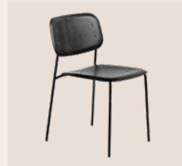
HAY EDGE kantine stol Mdl. lejepris DKK 80,-

Stabelbar kantine stol i let, organisk og komfortabelt design.