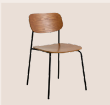
CLARA mødestol Mdl. lejepris DKK 80,-

Klassisk og tidsløs m/ træsæde og ryg. Sort pulverlakeret metal stel.