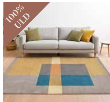
Squares Tones YELLOW 250x350 cm. Mdl. lejepris DKK 150,-