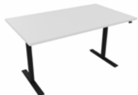
Hæve sænkebord 140x80 BASIC hvid/sort Mdl. lejepris DKK 145,-