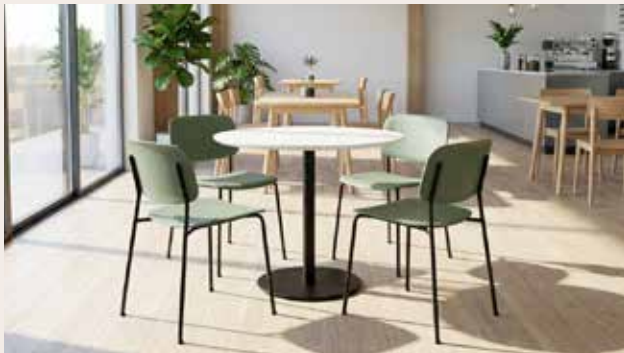
ZOLID EAT Ø80 kantine bord Mdl. lejepris DKK 95,-

Rund bordplade i sort el. hvid laminat. Søjlestel i sort med fast højde på 72,7 cm. inkl. bordplade.