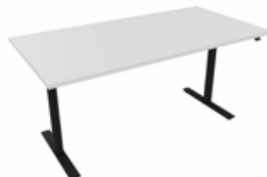
Hæve sænkebord 160x80 BASIC hvid/sort Mdl. lejepris DKK 150,-