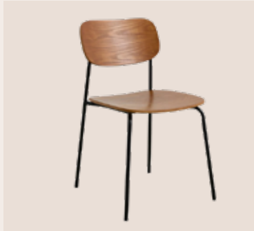
CLARA kantine stol Mdl. lejepris DKK 80,-

Klassisk kantine stol m/ træsæde og ryg. Sort pulverlakeret metal stel.