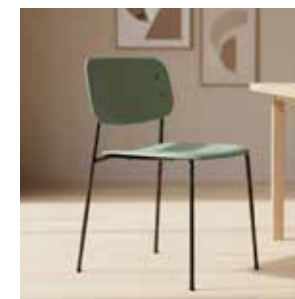
HAY Soft Edge 40 mødestol, grøn/sort Mdl. lejepris DKK 80,-

Mødestol fra HAY i let, organisk og komfortabelt design.