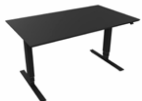
Hæve sænkebord 140x80 PRO sort/sort Mdl. lejepris DKK 155,-