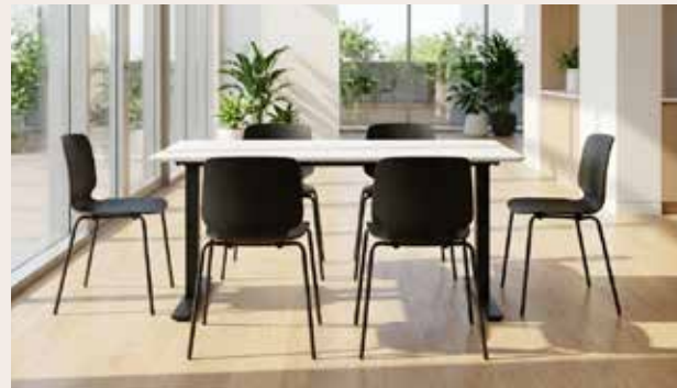
ZOLID EAT 140x80 kantine bord Mdl. lejepris DKK 125,-

Rund bordplade i sort el. hvid laminat. Søjlestel i sort med fast højde på 72,7 cm. inkl. bordplade.