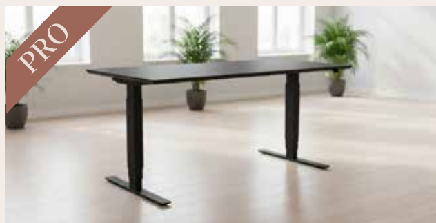
Hæve sænkebord 160x80 DKK 160,-

Højdejustering: 63 - 129 cm Bordplade: Sort linoleum med sort faset kant Stel: Pulverlakeret stål i valgfri farve