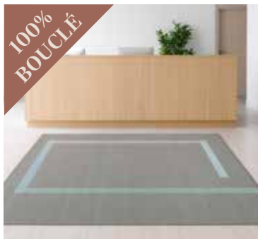
Natural Lines GREY/GREEN 250x350 cm. Mdl. lejepris DKK 100,-

Lej eksklusive, håndvævede tæpper i 100% New Zealand uld, der tilfører varme og forbedret akustik til både kontor , møderum og reception . Vores tæpper er skabt i højeste kvalitet til daglig brug i erhvervslivet og er både slidstærkt og rengøringsvenligt. Tæpperne tilbydes til en fast, lav månedspris..