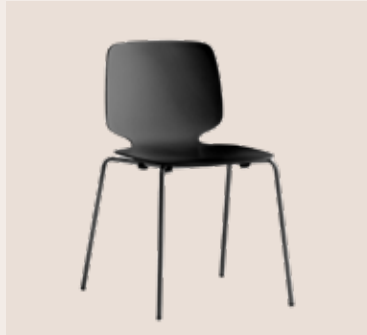
BABILA kantine stol Mdl. lejepris DKK 80,-

Klassisk kantine stol m/ træsæde og ryg. Sort pulverlakeret metal stel.