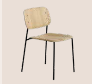
HAY EDGE kantine stol Mdl. lejepris DKK 80,-

Tidløs stol i stilrent og enkelt design med stålbænk og plastskal.