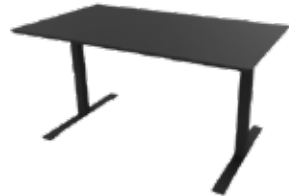
Zolid Meet 140x80 sort/sort Mdl. lejepris DKK 140,-