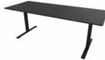
Zolid Meet 180x80 sort/sort Mdl. lejepris DKK 150,-