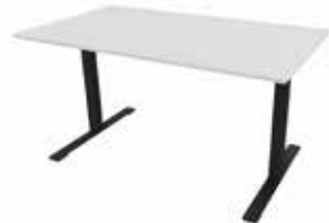
Zolid Eat 140x80 Mdl. lejepris DKK 125,-