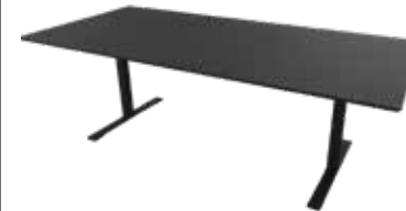
Zolid Meet 220x100 sort/sort Mdl. lejepris DKK 160,-