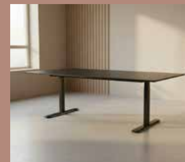
ZOLID MEET 220x100 Mdl. lejepris DKK 160,-

Bordplade: Sort linoleum Stel: Sort pulverlakeret stål Mål: B:180xD:80xH:72 cm.