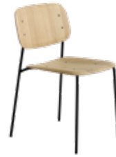
HAY Soft Edge 40 eg/sort Mdl. lejepris DKK 80,-