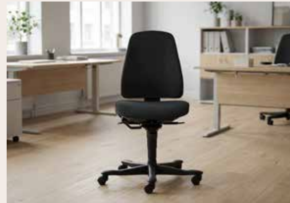
Kinnarps 6110 Mdl. lejepris DKK 150,-

Materiale: Fame stof, sort 4799 Stel: Sort Inkl. Freefloat vippemekanisme