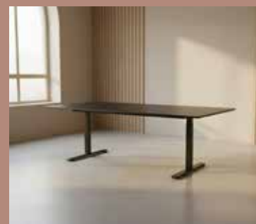
ZOLID MEET 180x80 Mdl. lejepris DKK 150,-

Bordplade: Sort linoleum Stel: Sort pulverlakeret stål Mål: B:140xD:80xH:72 cm.