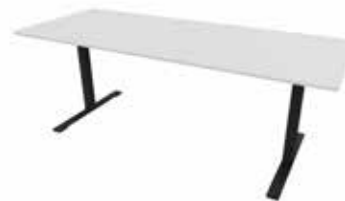
Zolid Eat 180x80 Mdl. lejepris DKK 145,-