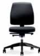
ZolZit 1 sort/sort Mdl. lejepris DKK 100,-