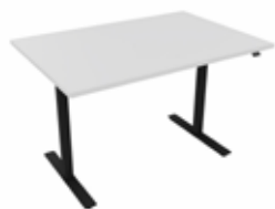
Hæve sænkebord 120x80 BASIC hvid/sort Mdl. lejepris DKK 145,-