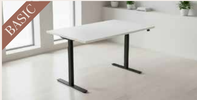
Hæve sænkebord 120x80 DKK 145,-

Vores BASIC hæve sænkeborde er udført med en flot og robust laminat bordplade med faset kant og elektrisk hæve/sænke stel i pulverlakeret stål.