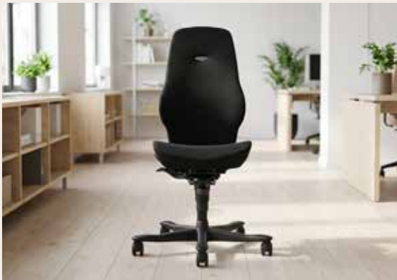
Kinnarps 6770 Mdl. lejepris DKK 165,-

Materiale: Lucia stof, sort YP009 Stel: Sort Inkl. synchronmekanisme