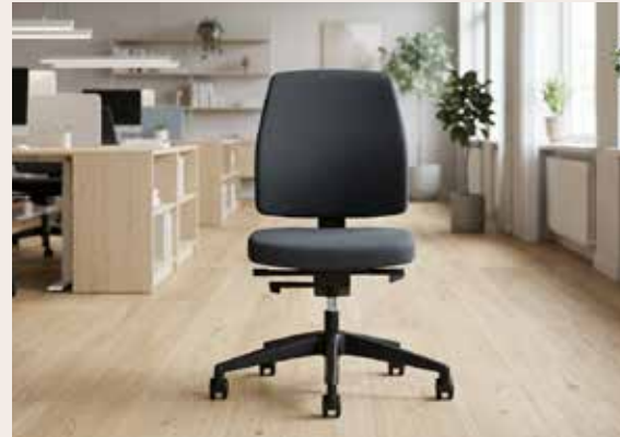
ZolZit 1 kontorstol Mdl. lejepris DKK 100,-

Materiale: Select stof, sort 60999 Stel: Vælg mellem silver eller sort Skift nemt mellem lave og høje arbejdsstillinger