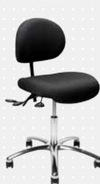
VELA Latin 100