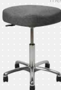
VELA Samba 410