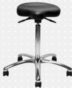
VELA Samba 130