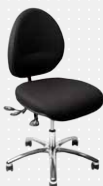
VELA Latin 200