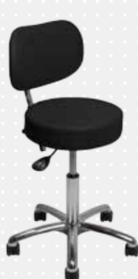
VELA Samba 520