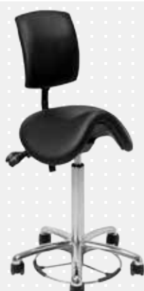
VELA Samba 400 med S150-ryglæn og fodbetjent højdeindstilling*