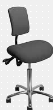
VELA Samba 150