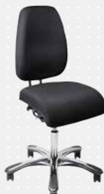
VELA Latin 400 med glidesæde