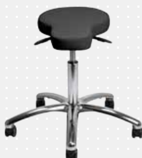
VELA Samba 530