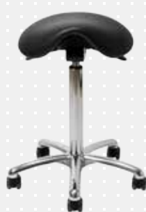
VELA Samba 400 med small sæde