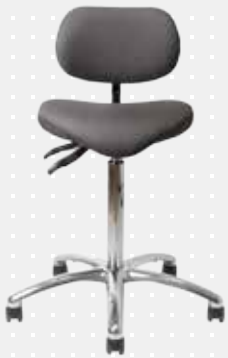
VELA Samba 100

VELA ståstøttestole skaber en stabil, høj arbejdsplads og støtter en ergonomisk arbejdsstilling. En ståstøttestol er perfekt som aflastende stol i en varieret arbejdsdag med både stående og siddende arbejde - både på jobbet og i hjemmet.