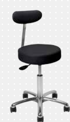
VELA Samba 510