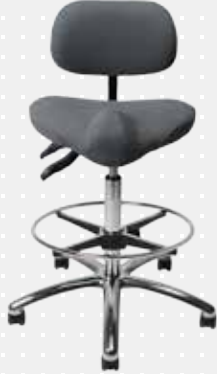
VELA Samba 110 med fodring*