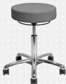
VELA Samba 500

VELA taburetter og ståstøttestole kan leveres med fodbetjent højdeindstilling. Stolene kan tilpasses brugeren med fx ryglæn og hjul. Alle stole har sædevinkling (undtagen VELA Samba 410, 500, 510 og 520) og 360° sæderotation. Tekst med * er tilbehør.