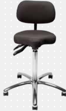
VELA Samba 120